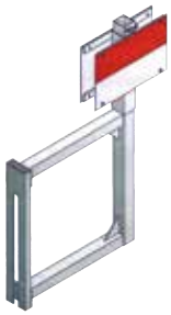
SUPPORT DÉPORTÉ TYPE SP1 en aluminium