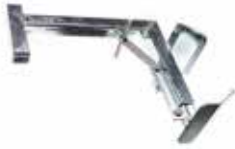
SUPPORT DÉPORTÉ POUR GLISSIÈRE MÉTALLIQUE en acier galvanisé