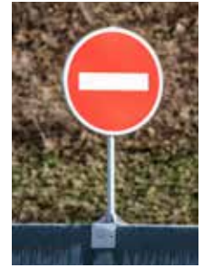
Support spécial pan- neau police Ø 60 Alu de 500. Plus-value au mètre.