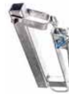
SUPPORT POUR GLISSIÈRE MÉTALLIQUE en acier galvanisé