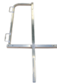
Croix de Lorraine type P en aluminium